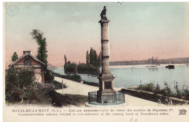
883 VAL-DE-LA-HAYE (S.-L.). — Colonne commémorative du retour des cendres de Napoléon I er . Commemorative column erected in remembrance of the coming back of Napoleon's ashes.

Ces cérémonies se sont faites dans le calme et le plus grand recueillement. L'autorité a veillé à ce que le bon ordre fût maintenu durant le jour et à ce que le service des troupes fût strictement fait durant la nuit. Le lendemain, vers 9 heures et demie, l'escadrille composée de 14 bateaux à vapeur est partie et s'est dirigée vers Rouen.